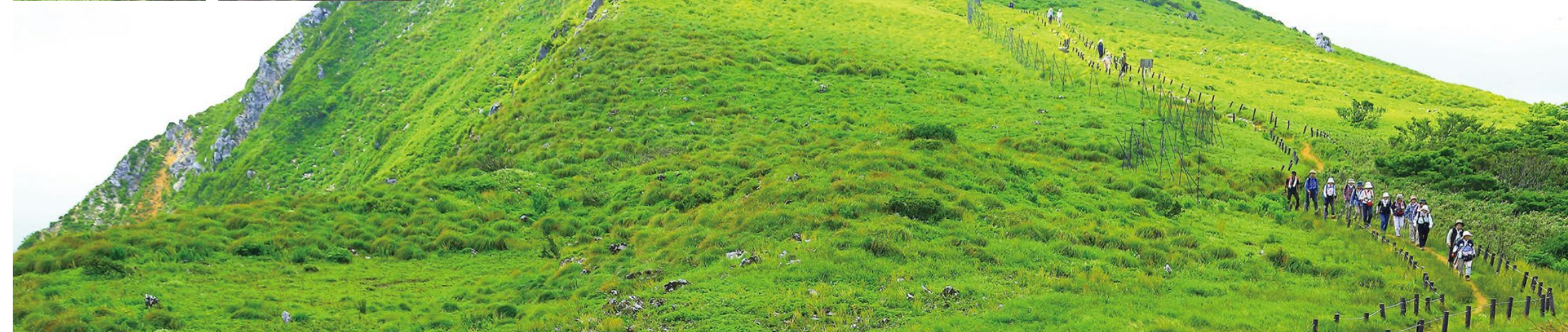
表紙写真：「白鷺神社（滋賀のええファト☆コンテスト2015夏）」「伊吹山（滋賀のええファト☆コンテスト2016夏）」