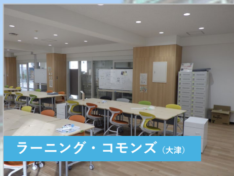
ラーニング・commons (大津)