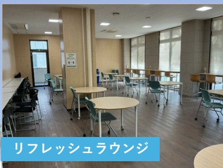
リフレッシュラウンジ