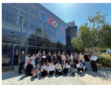
海外研修Ⅱ(アメリカ)