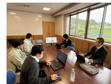
奈良県山添村における公共施設見直しヒアリングの様子