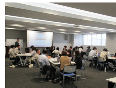
滋賀県米原市における行政改革研修・グループワークの様子