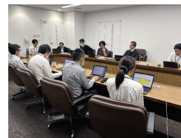
兵庫県加東市における業務の棚卸しヒアリングの様子