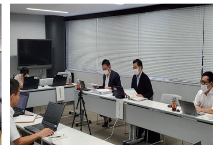
伊賀市における指定管理者制度導入施設見直しヒアリングの様子