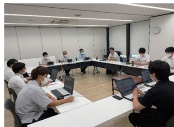
高浜市における事務事業見直しヒアリングの様子