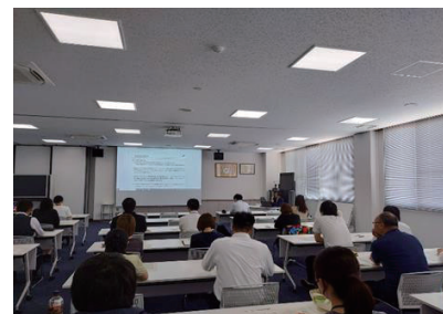
豊郷町における行政評価研修の様子