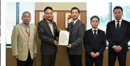
彦根市長・副市長へ事務事業見直し結果を報告