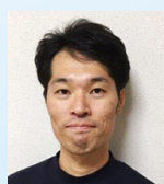
滋賀大学 産学公連携推進機構 社会連携センター プロジェクトアドバイザー プランニングオフィスディギン 代表

素晴らしい自然環境を持つ滋賀県をこよなく愛し、琵琶湖を舞台 とし未来の観光のあり方を常に考えている。