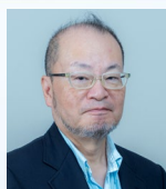
滋賀大学 産学公連携推進機構 特別招聘教授 (全体コーディネーター)