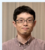
滋賀大学 産学公連携推進機構 社会連携センター 客員教授 博士(学術) 悠ツアー 代表

ウエルネスウォーキングを提唱。神戸市内を中心に各地でその 普及に尽力している。日本ウエルネスウォーキング協会会長。