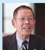
(一社)日本エコツーリズム協会 理事

20年以上旅行業界勤務で、様々なカテゴリーの旅行業務を経 験。その実績を活かし2006年12月、旅する女性のための旅行 会社、チェルカトラベルを設立。現在は、様々な観光事業者向 けアドバイザーとして活躍。