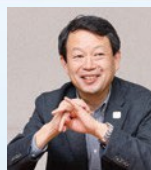
流通科学大学 人間社会学部観光学科 教授 日本観光教育ネットワーク代表

産学連携プロデューサー。パナソニック(株)にて、生活家電の トータルマーケティングを担当。2018年度から本学で産学連携 活動を推進。講義「アントレプレナーシップⅠ・Ⅱ」を担当。