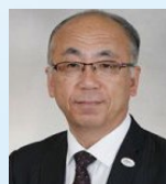
(公社)びわこビジターズビューロー 会長

海外の方に向けて、滋賀の暮らし・なりわいを紹介する着地型 英語ツアー事業を展開。全国通訳案内士(英語)。