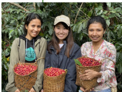
「現地スタッフとコーヒー豆を収穫」