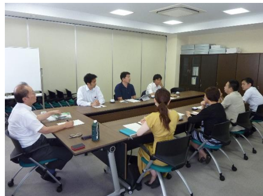
専任教員との面談の様子