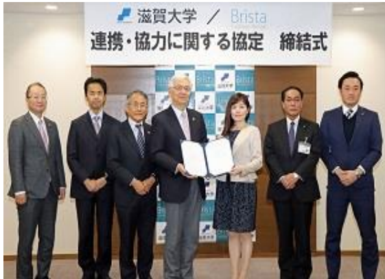
株式会社 brista との包括連携協定 (2020.1.20)