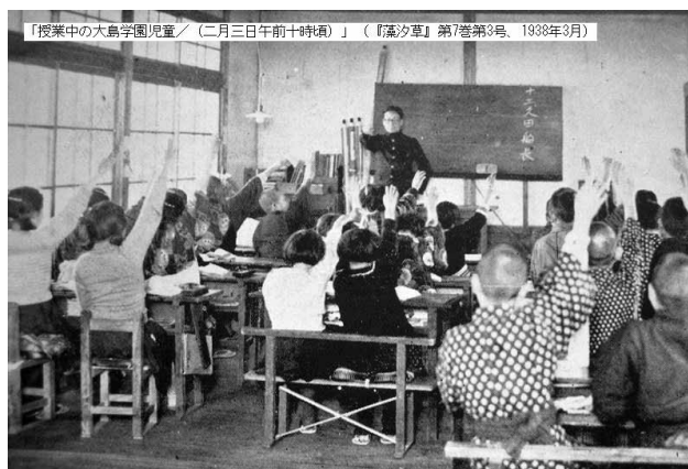
「授業中の大島学園児童／（二月三日午前十時頃）」（『藻汐草』第7巻第3号、1938年3月）