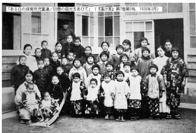
「ある日の保育所児童達／初春の慈光をあびて」（『藻汐草』第7巻第3号、1938年3月）