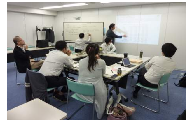
グループ討議の様子