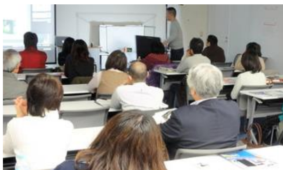
【満員御礼】ホームページやショッピングサイトで魅せる写真で売上向上