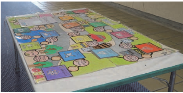
写真1 すごろく教材

すごろくは、SDGsの17の目標のロゴが示されたマスを含んでおり、各マスに貼られたロゴをめくると、SDGsに関連するミッションが与えられるという仕掛けがある。たとえば、目標8「経済成長と雇用」のマスでは「きみは大きくなったら何になりたい？みんなに伝えてみよう。言えたらシールをもらおう」、目標14「海洋資源」のマスでは「ちょうせんじょう〜うみの中にはいろいろな魚がおよんでいるよね！魚のものまねできるかな？さかなのなまえ3ついえるかな？どっちかできたらシールをもらおう！」といった形で、その場でほかのプレイヤーと体験を共有できる仕掛けがつけられている。また、与えられたミッションをクリアすると、SDGsの各目標のイラストが描かれたシールをもらうことができ、それらを台紙に貼って集めていくことができる。また、ほかにもコインの増減の要素があり、目標9「インフラ・産業化・イノベーション」のマスでは「たいへん！水道代と電気代をはらいわすれちゃった。水と電気が使えなくなった。3コイン払ってシールをもらおう」といったように、コインを使用するミッションが与えられる。また、募金マスがあるほか、コインを得ることのできるミッションもある。