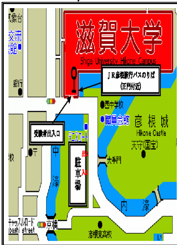
拡大図（駐車場近辺）