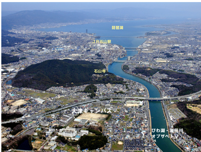
上空から見た大津キャンパス