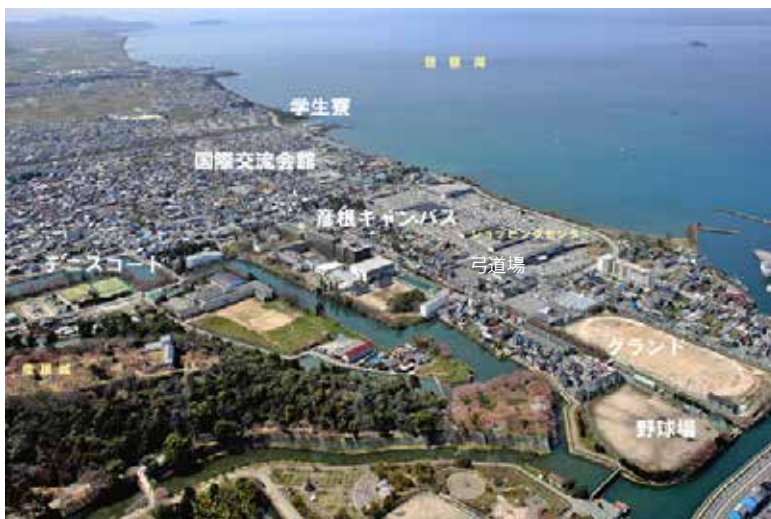
上空から見た彦根キャンパス